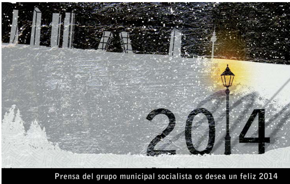
Prensa del grupo municipal socialista os desea un feliz 2014

Contáctanos en: presagrupo PSOE@madrid.es Tfno. 91 480 23 56